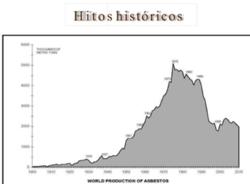
Gráfico nº 1: todo el mundo

Los datos numéricos disponibles convertidos, a través de un sistema de coordenadas cartesianas, en una expresión geométrica nos proporcionan una imagen que entreteje los distintos años del siglo XX con las cantidades de amianto consumidas en todos los países. La gráfica resultante es la siguiente: