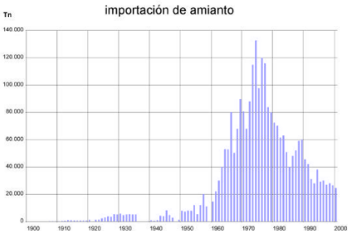
Gráfica nº 3: España

Como la minería del amianto en España, aunque existente, tuvo una producción bastante escasa, los datos de importación se pueden asimilar a los del consumo interior.